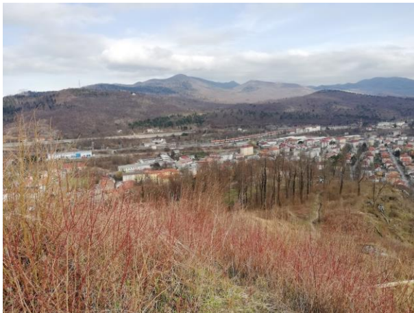
Pogled na Postojno