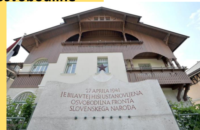
Ljubljana; Vidmarjeva vila