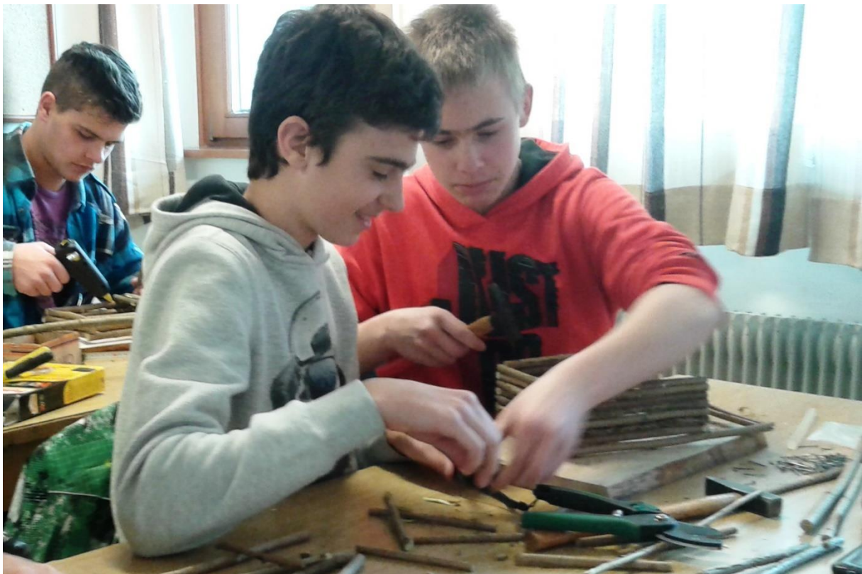
Slika 4: Dijaki pri izdelavi ptičje hišice.

Postopek ni zahteven in dijaki so ga hitro razvili in osvojili.