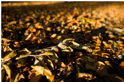
Slika 2: Kako v mestno okolje spraviti gozdno podlago za posebno doživetje, je vprašanje, ki smo si ga zastavili.

Tako smo oblikovali svojo čutno pot, kratko, a delujočo. Nabrali smo materiale iz gozda in okolice in iz njih pripravili čutno pot, ki se je lahko poslužujemo tudi v slabem vremenu ali pozimi. Uporabili smo storže, različne jesenske plodove, kostanje, posušeno listje, mah itd.