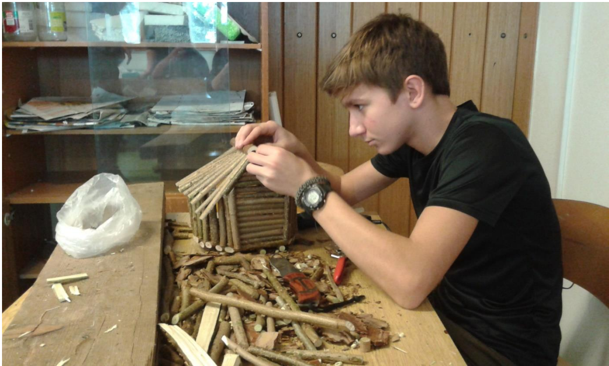
Slika 3: Naravni material nam nudi veliko možnosti za poceni in kakovostno ustvarjanje.

Postopek ni zahteven in dijaki so ga hitro razvili in osvojili.