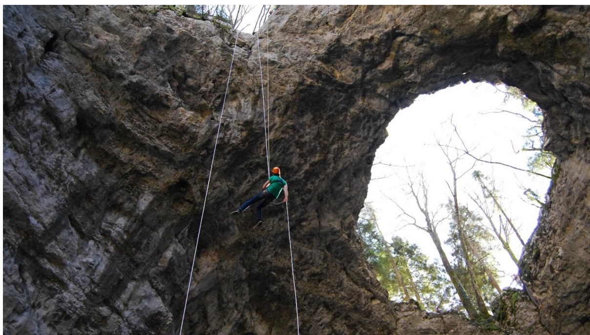
Slika 5: Avantura zagotovljena.

Ker gre za avanturo, ki je primerna tudi za začetnike, se le-ta izvaja od pomladi do jeseni, saj je takrat na voljo več divje hrane, vremenske okoliščine pa so primerne za nočitev na prostem.